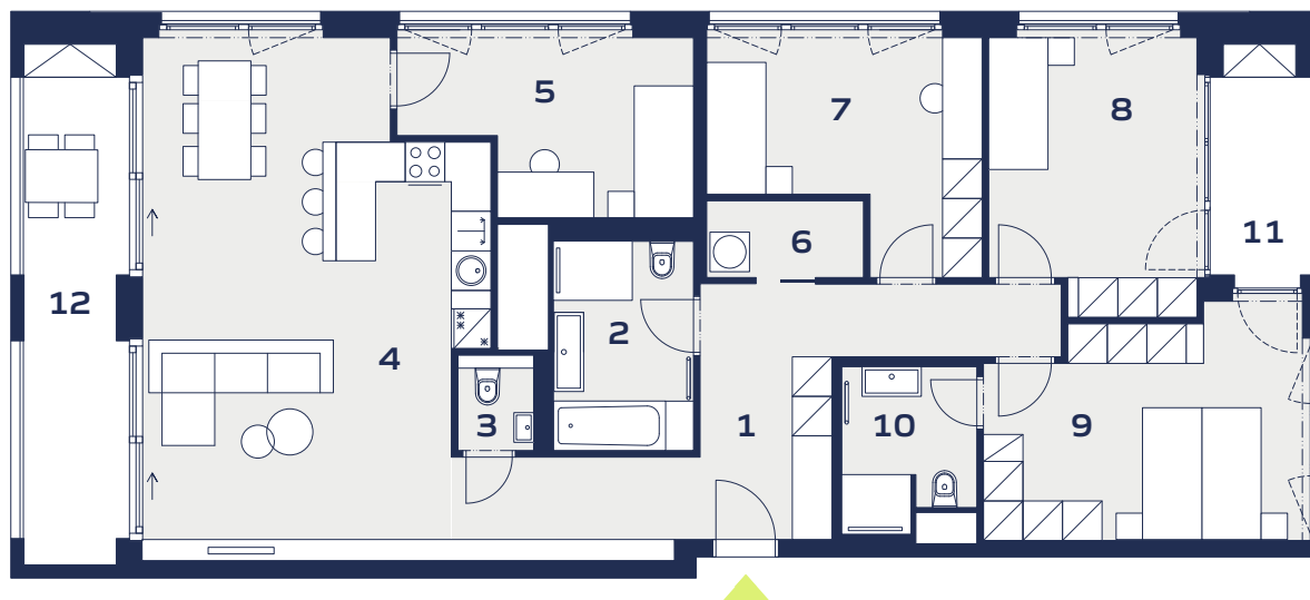
Budova / Building